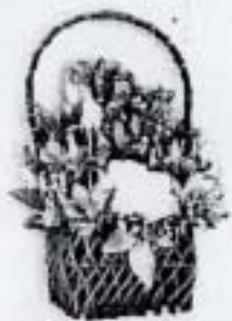
กระเช้าใหญ่ (20 x 28 ซม.) ราคา 450.- บาท