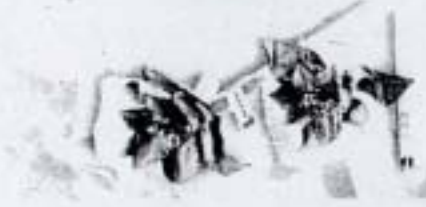
ปากกาแก้วกัลยา ด้ามละ 30.- บาท