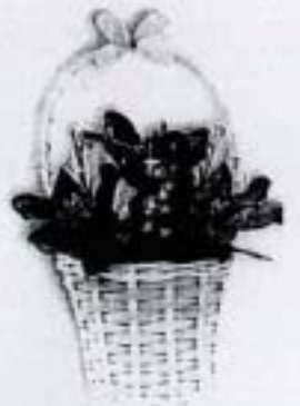
กระเช้าจ้ว (10x12 ซม.) ราคา 120.- บาท