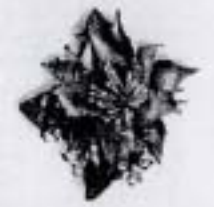
ดอกเดี่ยวมีดอกไม้แซม ราคา 40.- บาท