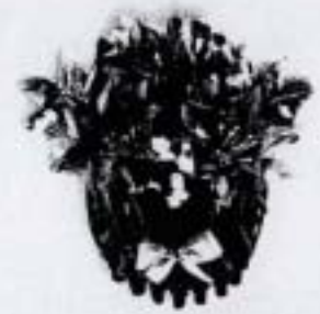
ตะกร้าเล็ก (10x22 ซม.) ราคา 180.- บาท