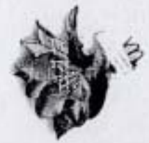
ดอกเดี่ยว ราคา 20.- บาท