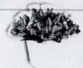
กระถางจ้ว (10x12 ซม.) ราคา 180.- บาท