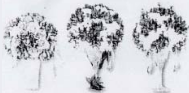
แจกันแก้ว (20 x 30 ซม.) ราคา 1,200.- บาท