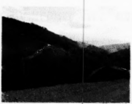
สภาพถนนไปหมู่บ้านก่อกัง นักเรียนต้องเดินเท้ามาเรียน