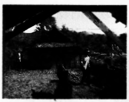
ชุมชนร่วมมือพัฒนาโรงเรียน ถนนภายในโรงเรียนชำรุดอย่างสม่ำเสมอ