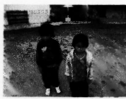
เด็กนักเรียนขาดแคลนและมีปัญหาด้านสุขภาพ