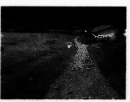
ฤดูฝนเป็นโคลนสัญจรลำบาก