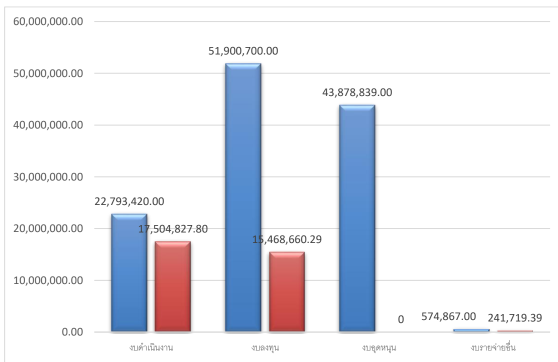
แผนภูมิที่ 2 แสดงการใช้จ่ายงบประมาณ ไตรมาสที่ 2 ปีงบประมาณ 2564