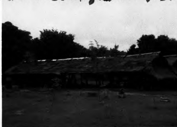
ศาลาภิขกรรมตสังแรกขงวัด ป็ชขัน ไค้ร้ชกขณแฉ้ว