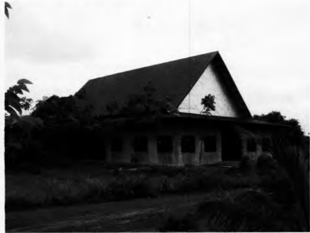
ศาลาการเปรียญตสังป็ชขัน ขยู่ไค้ระตว้างค้ำเนนการท้อสร้าง