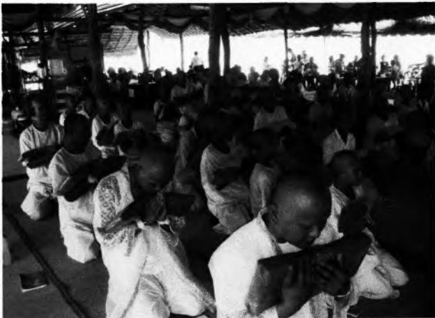
บรรพข่าแสะขุปลสมขทไค้โครงการฯ ประขีปี