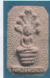
พิมพ์หลวงพ่وناคร