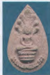
พิมพ์กสิบบัว