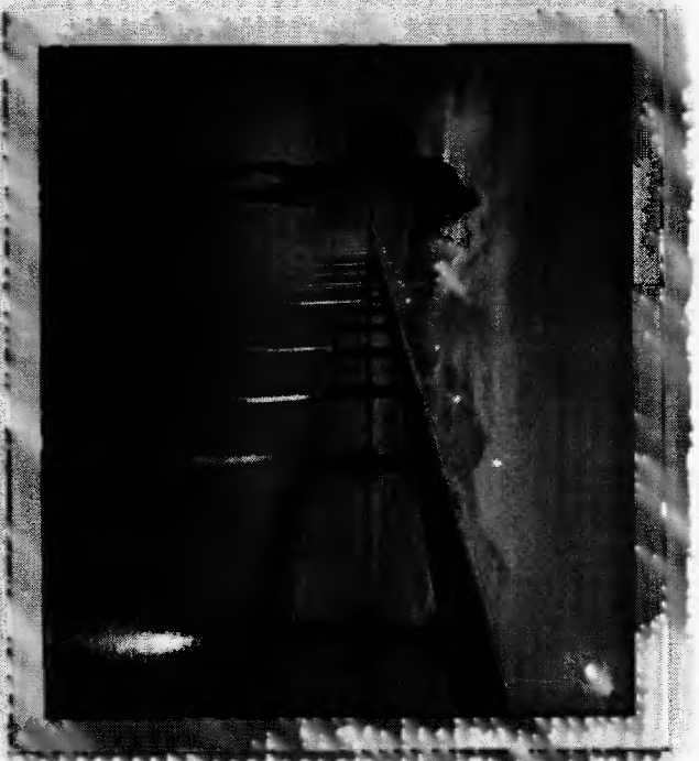
สะพานเทพภูตา

(ค่าพาหนะ,ค่าเข้าชมพิพิธภัณฑ์,ค่าอาหารกลางวัน