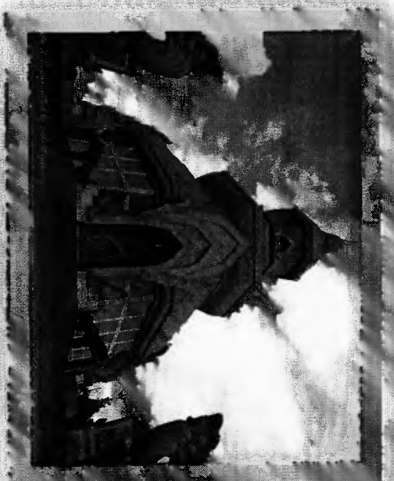
วัดภูคำว พระพุทธไสยาสน์