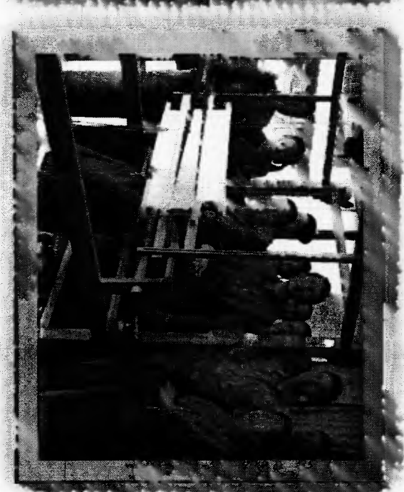
บ้านนาบอน คำม่วง