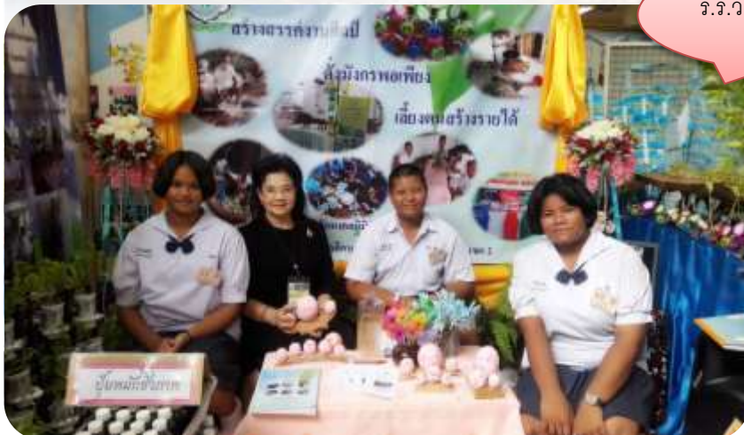
ร.ร.วัดมงคลนิมิตร